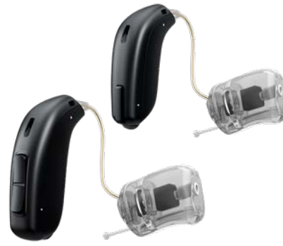
Embout Power Flex